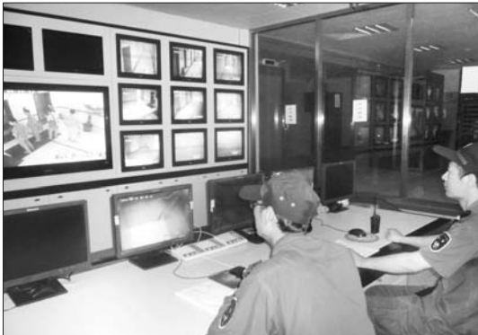
值班人员从监控室查看被“困”乘客的情况。

此次模拟两种情况,一是乘客是处于轿厢平层上,二是乘客是处于轿厢平层下600厘米范围内,被困者在维修人员打开层门后,即可离开。二是处于其他位