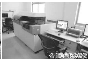
全自动生化分析仪