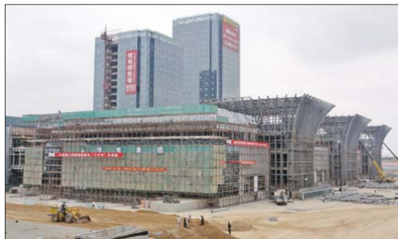
正在建设的绿地缤纷城将成为西客站片区的商业核心。

而按照日前发布的《济南市商业街建设和提升规划(2011-2020)公示稿》,在唐冶新区的商业中心区域,将打造一条长约800米的综合商业街,通过发展各类专业店、专卖店和百货店形成综合性商业街区,同时发展部分餐饮、时尚生活休闲、娱乐、金融、信息服务等辅助性网点作为街区的有机补充,构建济南市东部新城休闲购物场所。