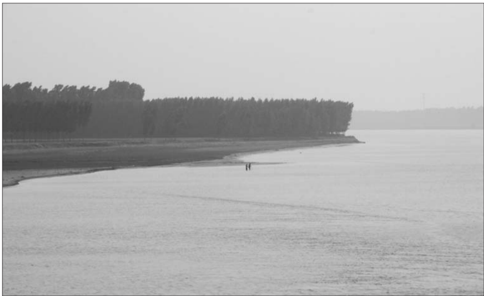
白龙湾在这里呈南北走向后,拐角处的大土垒子上树木长势茂盛。