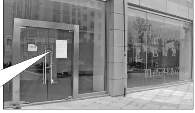
售楼处人去楼空, 大门紧锁, “债主”在玻璃门上贴上了招租广告。