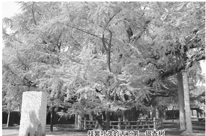
枝繁叶茂的天下第一银杏树