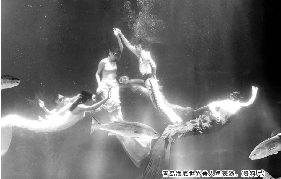
青岛海底世界美人鱼表演。(资料片)

梦泉、潭溪山、峨庄瀑布群常年对在校学生实行门票半价;暑假期间,原山国家森林公园、鲁山国家森林公园、开元溶洞、文姜祠、莲花山、牛郎织女景区、九天洞景区、618战备电台旧址景区对所有在校学生推出半价门票;樵岭前景区博山溶洞凭学生证可享受55元/人到20元/人的门