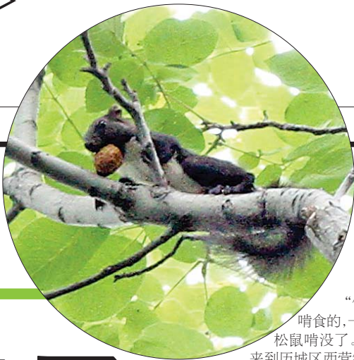
松鼠爬上高高的核桃树,嘴里还叼着核桃。

随着南部山区生态环境的改善,小动物多了起来,令人欣喜。眼下正是瓜果成熟的季节,历城区西营镇西营村的核桃树却遭到了“鼠患”,不少松鼠啃食了尚未成熟的核桃,令果农们忧愁和无奈。果农希望在保护野生动物的同时,能得到相应的补偿。