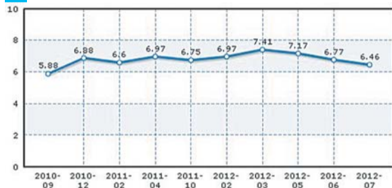
烟台90号油价历史及走势图