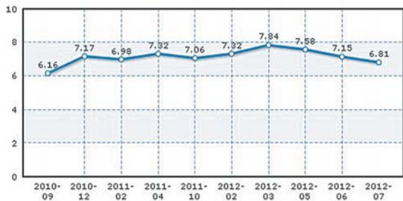
烟台0号柴油油价历史及走势图