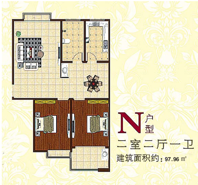
N 户型 二室二厅一卫 建筑面积约: 97.96 m 2