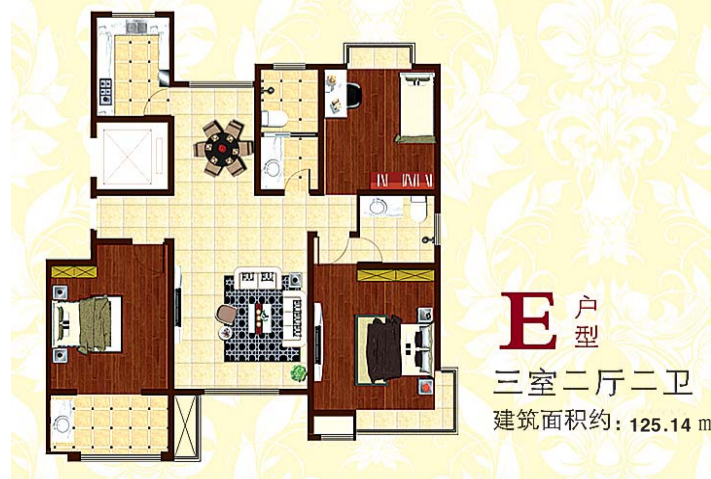
E 户型 三室二厅二卫 建筑面积约: 125.14 m 2