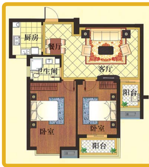
西单元5-B户型 2室2厅1卫1厨 建筑面积约: 96.02 m 2