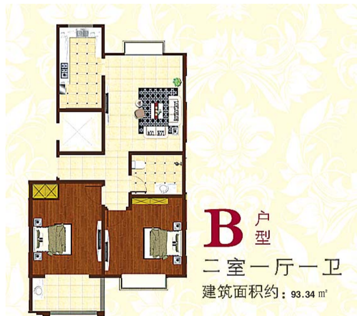
B 户型 二室一厅一卫 建筑面积约: 93.34 m 2