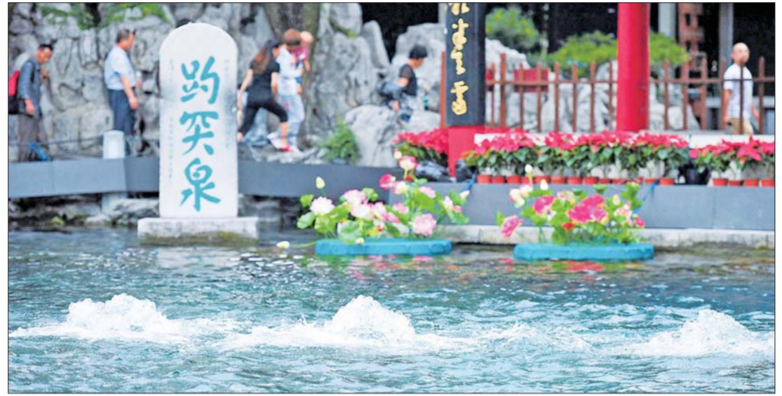
趵突泉复涌九周年纪念碑

泉水是济南的灵魂,可是到目前为止,济南却没有一个和泉水有关的节日。这对生活在泉边的济南人而言,不能不说是个遗憾。 今年,在广大市民的大力呼吁下,泉水节终于提上日程。众多旅游专家及业内人士也纷纷为泉水节支招。大家一致认为,济南的泉水节应该被打造成一场全民狂欢节。