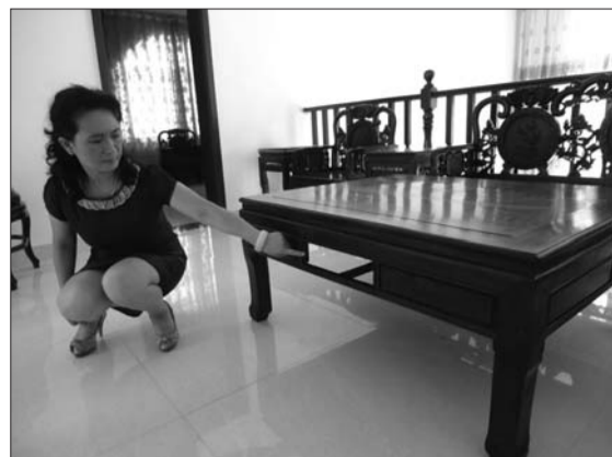
这就是蔡女士买的家具。