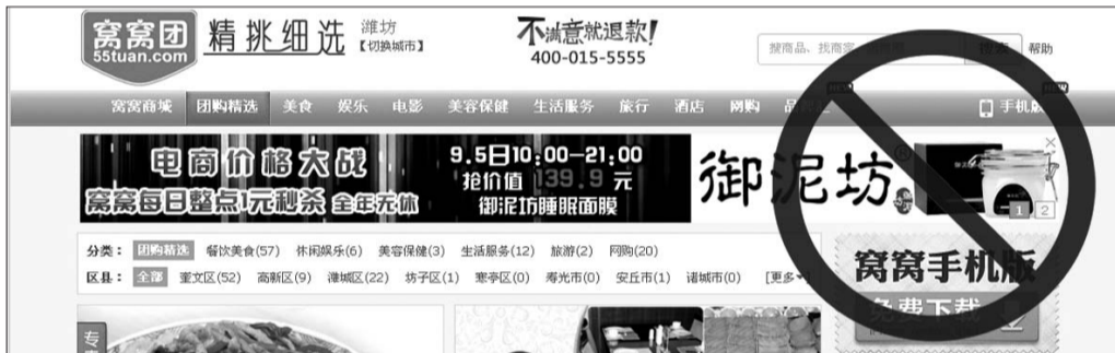
以后不挂营业执照的网店将被取消。