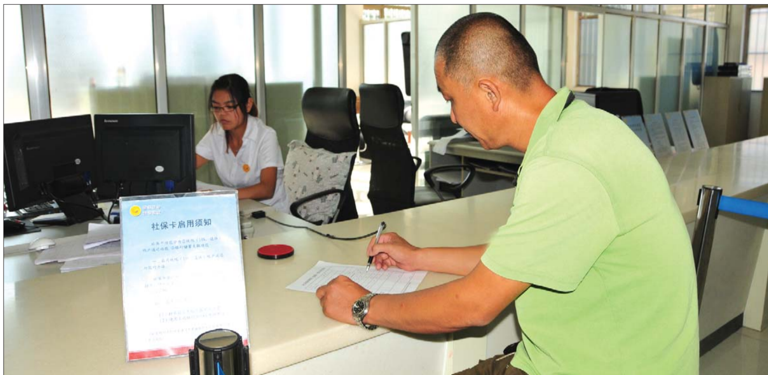
一位市民办理社会保险登记申请表。本报记者 赵苏炜 摄

2009年,泰安市民拿到第一张集医保、养老、失业、工伤、生育保险等多项功能的新社保卡,到如今短短3年时间,泰安社会保障事业不断给出“惊喜”:全市职工和居民医疗保险有了统一标准,月人均养老金翻了一番。