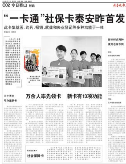
《“一卡通”社保卡泰安昨首发》2009年7月17日

人社局工作人员介绍,规范企业劳动用工管理,规模以上企业劳动合同签订率达98.5%以上。全市检查用人单位1.8万户次,涉及职工114.5万人次,为劳动者解决拖欠工资7860.8万元;受理立案举报案件1822起,结案1817起,结案率99.7%。完善劳动人事争议全程调解机制,全市建立基层调解组织3600个,聘用专兼职调解员1.4万人,形成了全程调解、全面调解、全员调解的大调解格局,全程调解机制被称为“泰安模式”在全省全国推广。