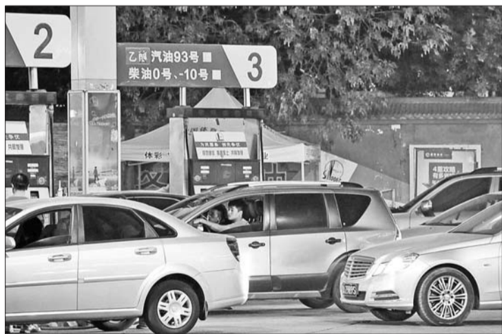
10日晚,济南历山路一加加油站,不少车主抢在油价上涨前排队加油。