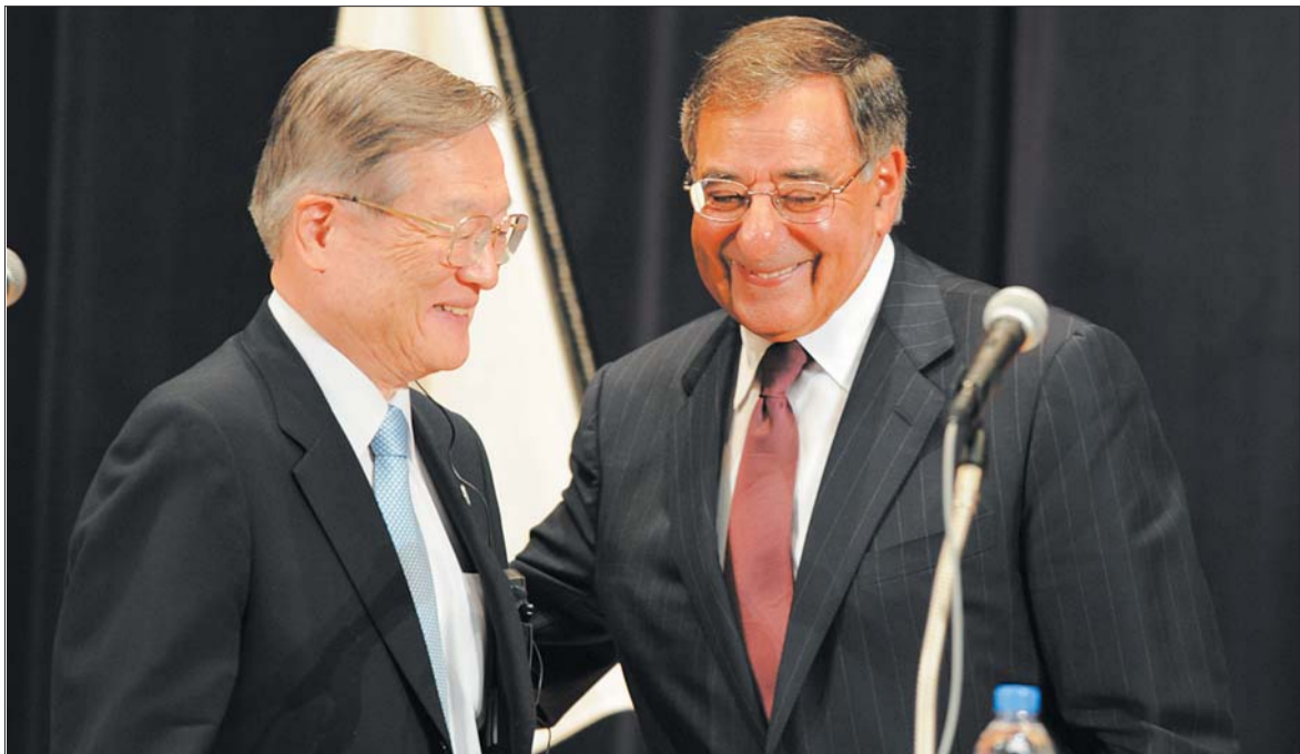
9月17日,美国国防部长帕内塔(右)和日本防卫大臣森本敏在东京防卫省参加记者招待会。

倪峰说,美国重返亚洲,各方都有利益博弈。中美若能合作,在亚太地区将有很好的示范效果,有助于地区的和平与稳定。