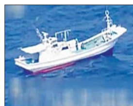
五名日本人乘船驶向钓鱼岛。

在18日的中国外交部新闻发布会上,新闻发言人洪磊说日本右翼分子非法登上中国领土钓鱼岛是侵犯中国领土主权的严重挑衅行为,中方向日方提出了严正交涉,要求日方对纵容右翼分子的行为做出解释。我们敦促日方采取有效措施,停止一切激化事态和矛盾的行为。同时,中方保留采取进一步措施的权利。