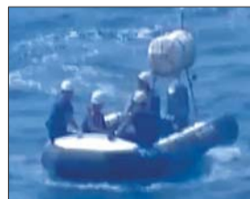
换乘橡皮艇,两人下海游泳上岛。(视频截图)