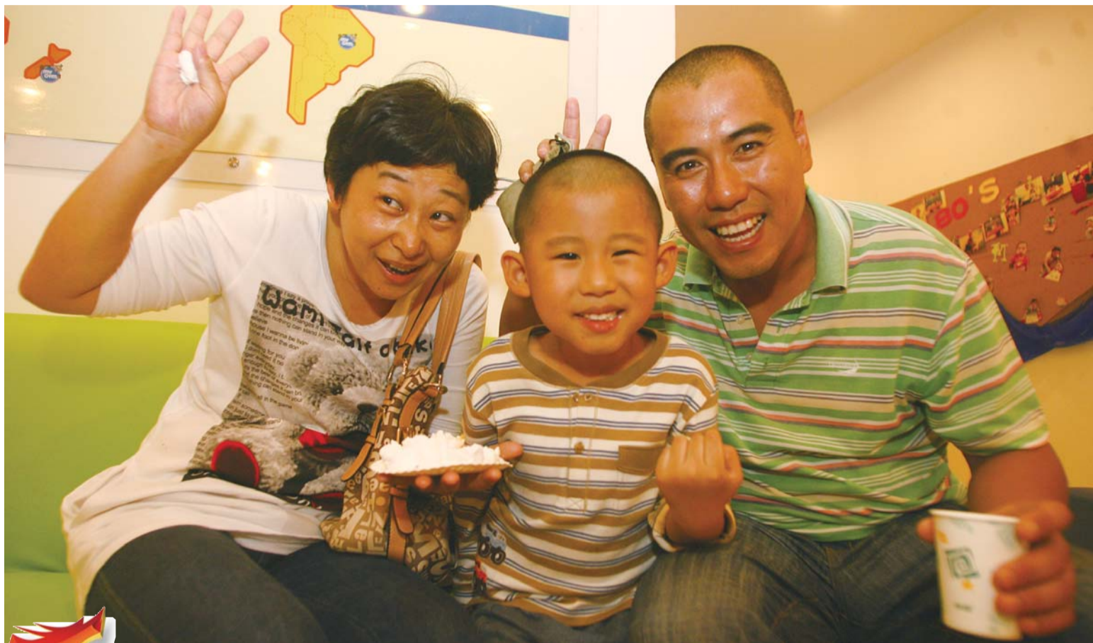
◀看这一家三口的乐呵劲儿。