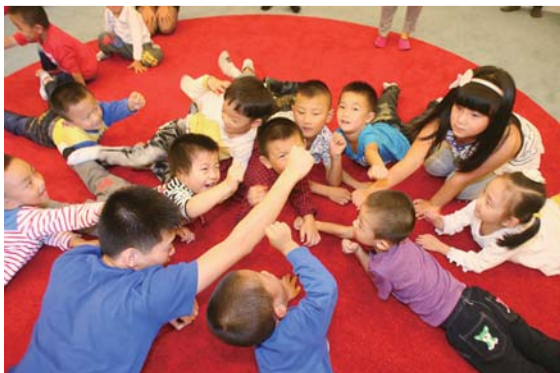
▶“小寿星”们在体验美吉姆早教中心玩各种精彩活动。