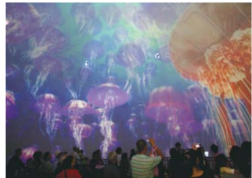
▲“小寿星”在鲸鲨馆观看国内首家高科技360°全息天幕电影。

由于27日是正常工作日,不少小读者都由老人陪伴而来。一位老人告诉记者,27日的时候,孩子爸妈已经为孩子订好了生日蛋糕,“在这里和大家共同庆祝生日后,中午回家亲朋好友还会再次庆祝。”老人说,尽管时间安排的满满当当,但孩子美得很。