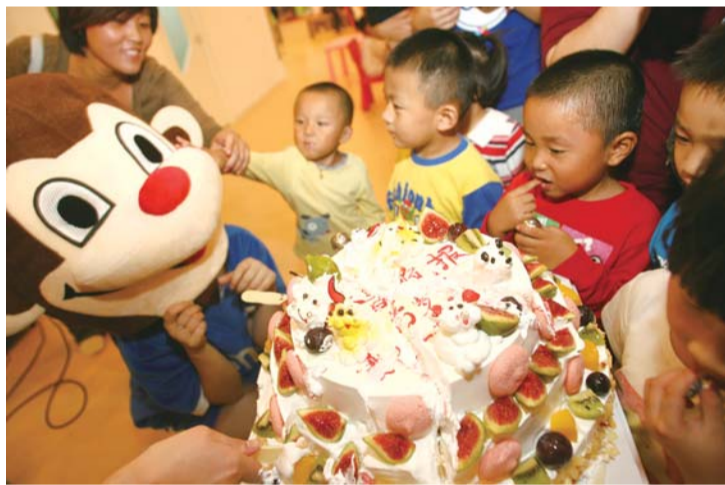
▲20名“小寿星”与本报共同庆祝五周年生日。

另外,在南大街美吉姆烟台早教中心,快乐起航幼儿园的10位小朋友特意小寿星们准备了舞蹈表演。小寿星们在尽情的游戏后,还品尝了本报精心准备的生日蛋糕。一天的行程中,“小寿星”们都乐开了花。活动结束后,美吉姆早教中心的工作人员还为小寿星们准备了小礼物,大家一起度过了一个难忘的生日。