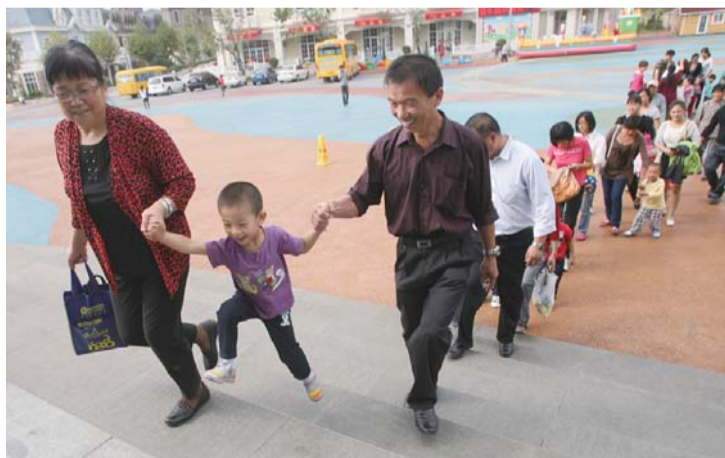
▲“小寿星”和家长们大步走进鲸鲨馆。