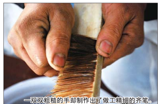
一双双粗糙的手却制作出了做工精细的齐笔。