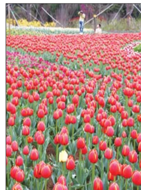
植物园郁金香绽放,煞是美丽。