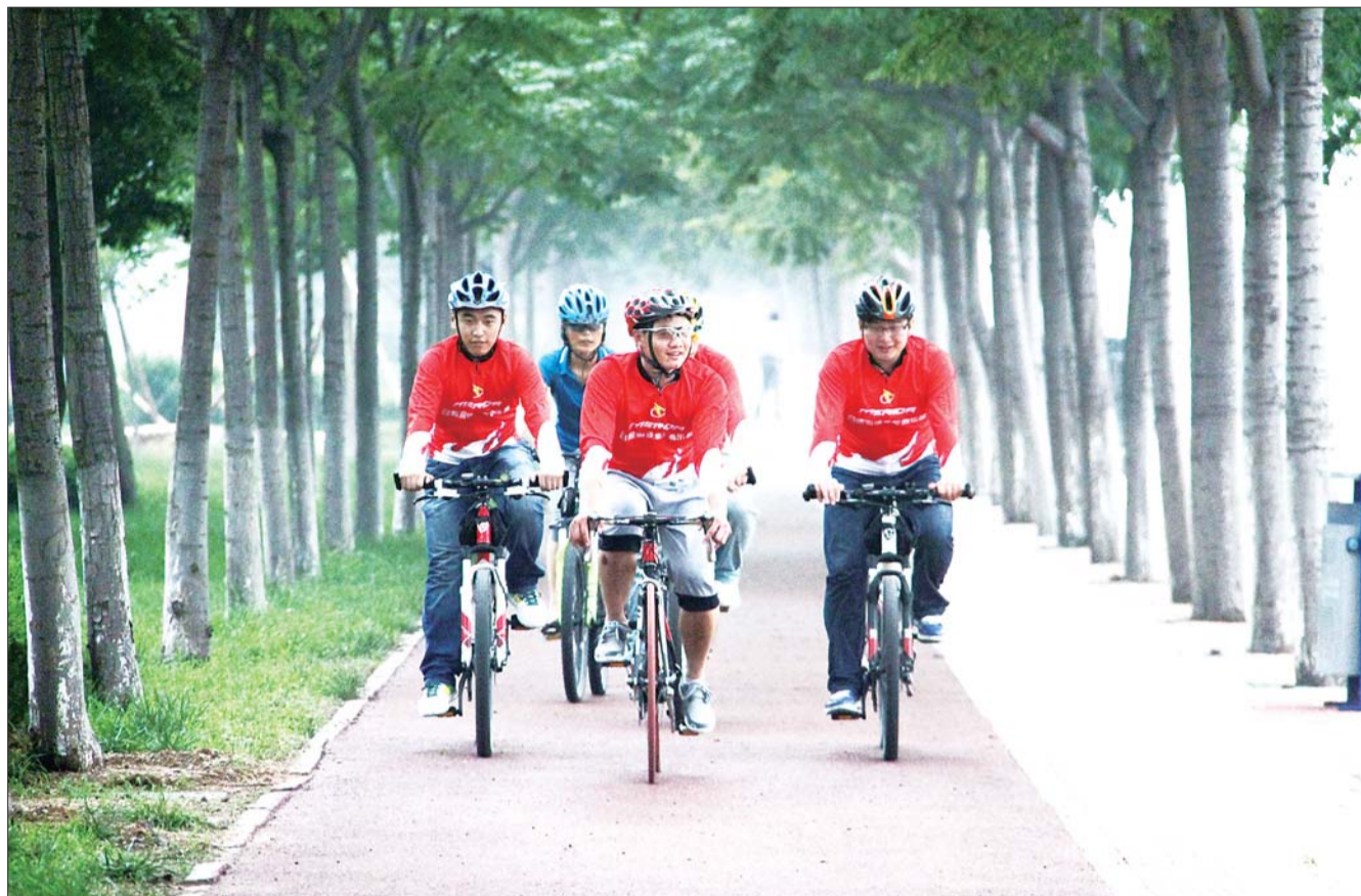
骑行爱好者在市区新建的绿道上骑行,践行低碳环保的生活方式。

今年日照市确定重点推进的旅游大项目63个,累计总投资1352.5亿元。重点抓了旅游景区建设工程、滨海旅游开发工程、文化旅游创新工程、星级酒店建设工程、大旅游基础建设工程、旅游要素建设工程六大工程,全面推动了日照旅游业转型升级。