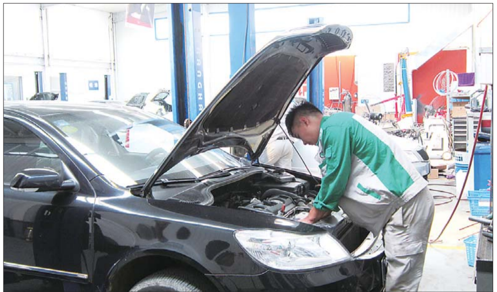
21日,一家4S店售后工作人员在为车辆做保养。

根据交通运输部预测,届时全省高速公路小型客车车流量将达430万车次。杨经理建议,新手最好不要跑高速公路,以免出现紧急情况。