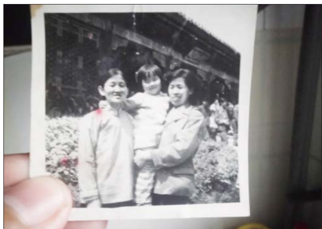
耿女士和大女儿以及外甥女在故宫的合影。