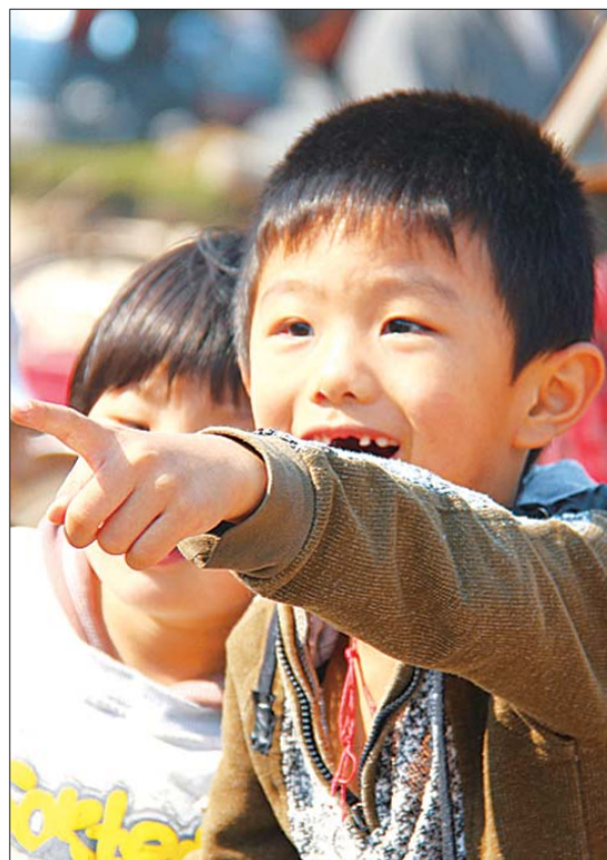
▶一个小男孩也被京剧吸引，惊喜不已。现在喜欢京剧、学京剧的年轻人太少了。