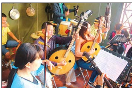
▲京剧院50多人，每人都有表演或伴奏任务。