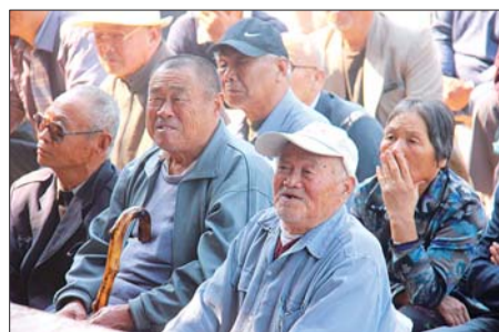
▲观众看得津津有味，他们多数是老年人。

9月30日早7点半，聊城市京剧院的演员们就来到龙山社区新时代广场。搭好的戏台前，几十位戏迷已经在等待演出开场了。八天长假，演员们要在这儿免费给市民送16场戏。