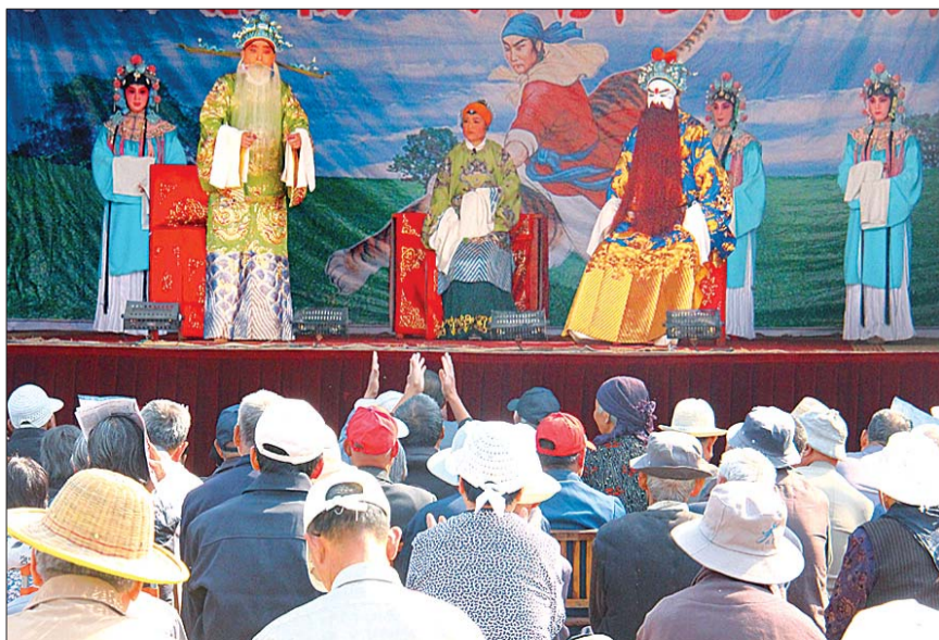
▲台下观众不停地为精彩的演出鼓掌叫好，有些观众为赶来看戏都顾不上吃早饭。