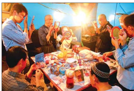
▲演员们每人拿着一面镜子化妆。