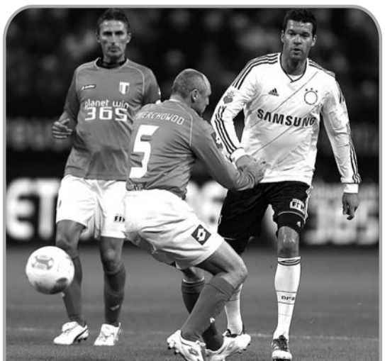
10月14日,德国队球员巴拉克(右)防守意大利队球员,当日,一场被称为“世纪之战”的慈善义赛在德国法兰克福举行,由前国家队队员组成的德国队与意大利队上场交锋。

近年来,NBA一直在积极探索更好的发展战略,拥有亿万篮球迷的中国市场自然是发展的重点,NBA的中国战略正在加速。(新闻)