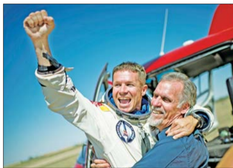
10月14日,鲍姆加特纳(左)成功着陆后庆祝。

鲍姆加特纳的惊人一跳打破了尘封52年的世界纪录。在此之前超高空跳伞的纪录由前美国空军上校乔·基廷保持,他在1960年8月16日创造了10.8万英尺(约为31300米)的高空一跃而下,不过当时的装备并没有如今这么先进。