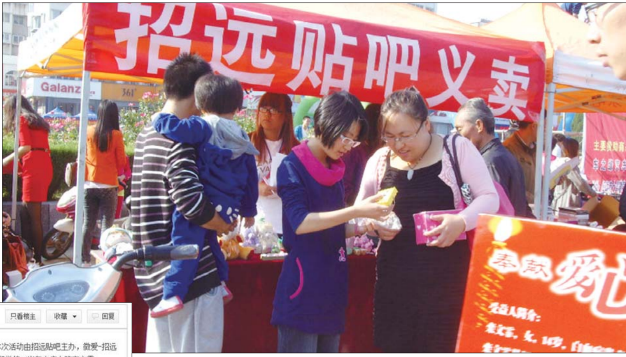
►10月2日,招远贴吧的义卖现场。 ▼招远贴吧2012年10月爱心义卖活动总结(截图)。

在这条路上,吧友们承受着来自内部和外部的压力,但他们依然选择坚定地走下去,给有爱心的一个释放爱的窗口。