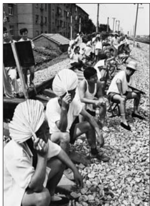
市民在桥下观看。1998年,济南市民观看顺河高架跨铁路桥合龙。