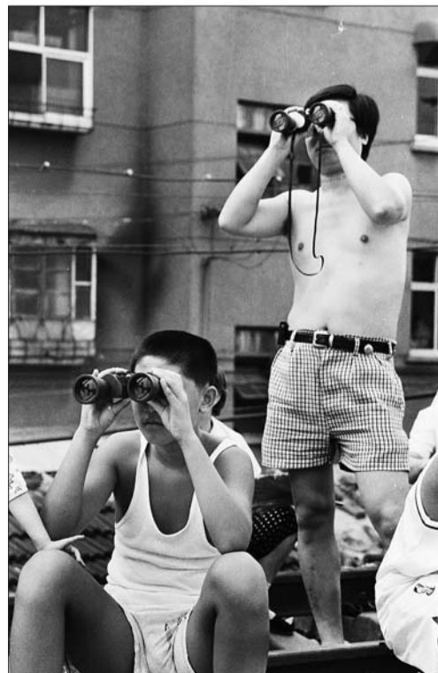
1998年,不少市民用望远镜观看建设中的顺河高架桥。