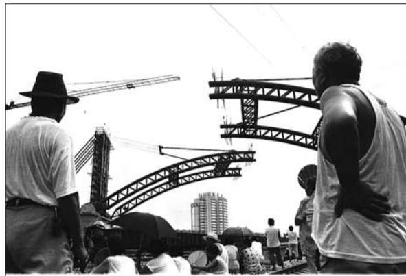
1998年,济南市市民观看顺河高架跨铁路桥合龙。

14年,从时间维度上讲,其实并不遥远,但对于当年目睹顺河高架通车盛况的济南市民而言,却仿佛已是很遥远的事了。