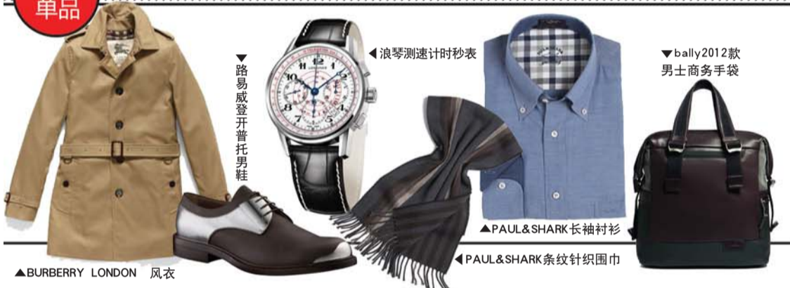
▲BURBERRY LONDON 风衣