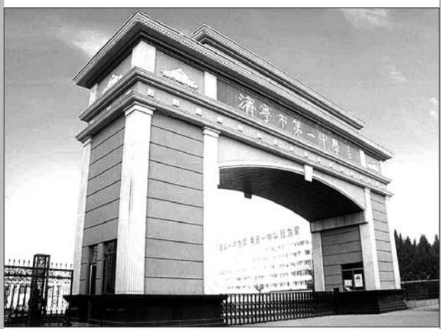
如今的济宁一中古槐校区大门。