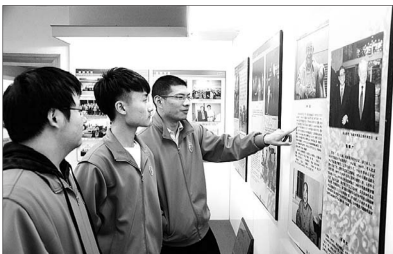
一起感受学校的历史。