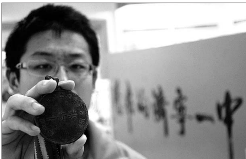
充满回忆的老奖牌。