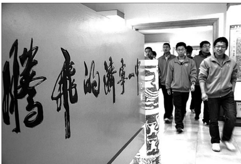
倍感自豪的一中学子。

所以然来。站在一旁的老师告诉他们:“这‘红楼’就是咱们东校区进门那幢办公楼位置所在,想当年也是济宁市最高的建筑物,站在运河大堤上放眼整座济宁城,能看到的建筑物就是这座红楼和铁塔寺的铁塔。” 听了老师的解读,同学们都发出了赞叹声。就在大家准备离开校史馆的时候,同学们又围在大厅里摆放的济宁一中两个校区的微观模型,每个人指着学校的各个教学楼,回忆自己读高一、高二时都在哪间教室里上过课,“这是我们在一中的最后一年了,看着这些学校的缩影,我们心中很是不舍。”