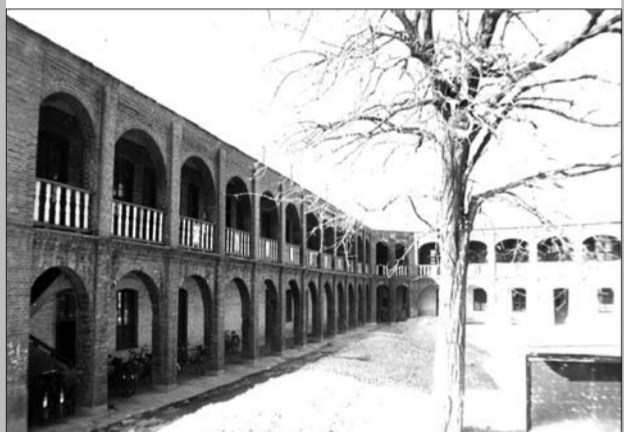
济宁一中曾经的教学楼。