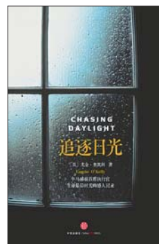
《追逐日光》 【美】尤金·奥凯利 蒋旭峰 译 中信出版社