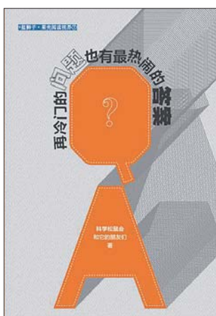
《再冷门的问题也有最热闹的答案》 科学松鼠会和它的朋友们 浙江大学出版社

事业、理想、爱情,都是吃饱肚子之后才有的事情。因为吃我曾经丧失过自尊,因为吃我曾经被人像狗一样地凌辱,因为吃我才发奋走上了创作之路。”