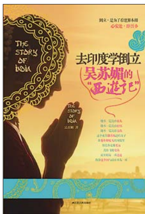
《去印度学倒立》 吴苏娟 江苏人民出版社

在都市所谓的“白领”生活过得太久,慢慢地生出了许多强迫症来。例如每天早晨不洗头就不能出去见人,每天都要换一身衣服,一个星期不重样,发生了任何超常规的事情(例如