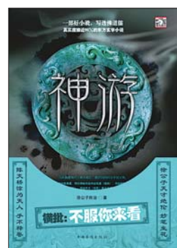
《神游》 徐公子胜治 中国华侨出版社

记得我七岁那年,有一天傍晚在村口玩耍,看见村东头的三大爷拄着拐杖走过来。三大爷经过我身边时,我很有礼貌地跟他打了个招呼。可是三大爷没有答话,只是很奇怪地看了我一眼,还轻轻叹了一口气,然后独自一人走向村外的昭亭山。我当时也觉得很奇怪,因为三大爷的腿脚不好,很少出门,怎么会一个人上山呢?