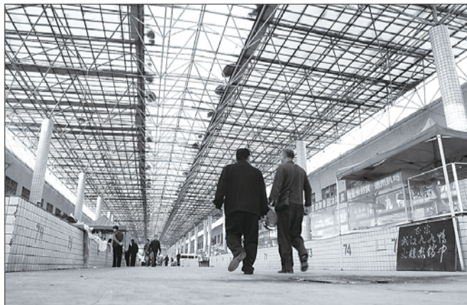
存在12年的农贸市场将成为历史。

随后记者联系到了住建委质监站的田站长,据田站长介绍说,农贸市场改造已经纳入计划,现有的农贸市场将会改造成类似于沂州路商业街一样的步行街,将现有的大棚、承重的柱子和摊位全部拆除,两侧的房子保留,并统一进行外立面装饰。在步行街中间设置景观,适当地种上一些树,地面全部铺装起来,车辆进行统一管理,运菜的货车限时出入。