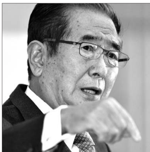
25日,石原慎太郎在记者会上宣布辞职。

日本政坛形成“第三极”势力,新党将给日本大选注入民族主义情绪“亢奋因素”,给日本政坛搅局。 “但这个政党不会有很大市场。”蒋丰说,日本民众目前有普遍的失望情绪,不可能再选一个没有任何经验的党成为执政党。 据人民网