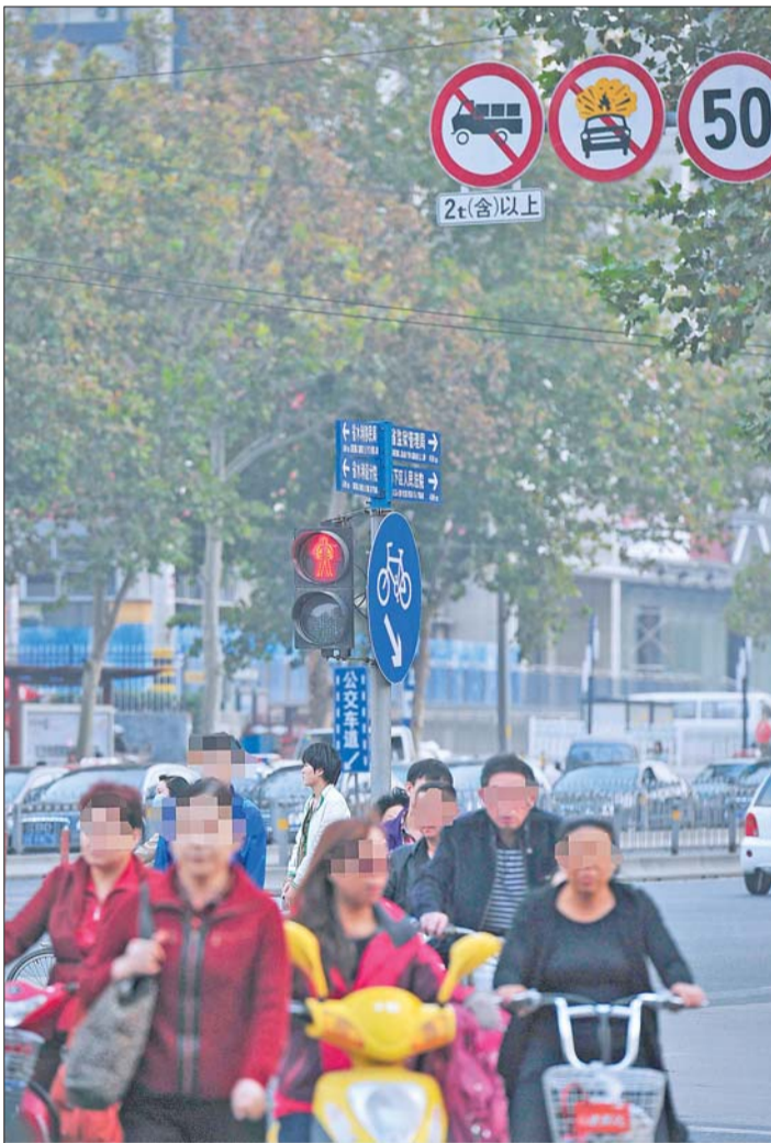
▲25日下午,济南历山路与和平路口,行人闯红灯现象比较多。