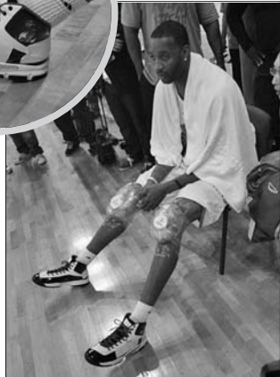
麦迪为双膝进行了冰敷。