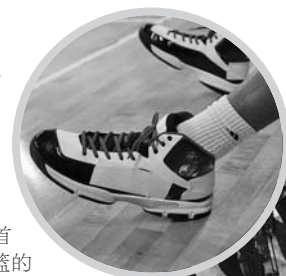
麦迪球鞋上贴着胶布,赞助商隐去。