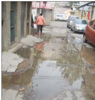
居民楼前的道路形成积水。记者 侯艳艳 摄