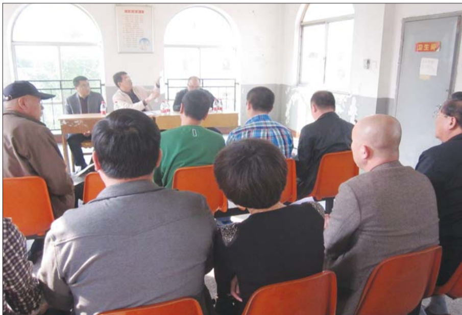
城管局及热力公司负责人正就业主疑问进行解答。

城管部门相关负责人称,双方可委托有资质的第三方进行测量。费用由责任方承担,如果双方都无人愿意“买单”,那城管局将负担这部分费用。