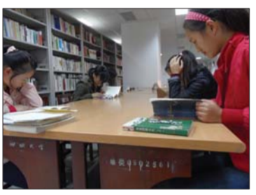
在聊大图书馆,读者正在阅读。

工作人员介绍,馆内现设采编部、外借部、阅览部和电子阅览部。在藏书特色上注重综合性、公共性和地方性。现有藏书20多万册,其中纳入计算机管理的书刊就有十多万册,古籍图书近万册,还有报刊订本、地方文献、年购报刊等。