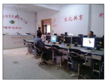
在海源阁图书馆电子阅览室内,读者在查阅资料。

聊城市海源阁图书馆位于东昌府区楼南大街,是一所市级公共图书馆。现在每天上午8:30至下午5:30免费向市民开放,全年无休,市民只需缴纳定额押金,即可凭借书证免费借阅。