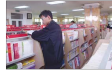
聊城市图书馆新馆效果图。

目前聊城市图书馆新馆已正式立项,预计2012年12月31日前开工建设,2013年12月完工。