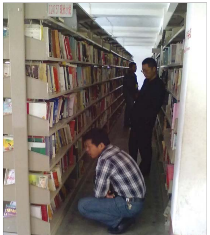
在海源阁图书馆,几名市民正找书看书。

记者在书店看到,儿童天地专区占了整个一楼近一半的面积,其次是励志理财作品,三楼中小学生学习资料占了多数,其次是儿童或教育音像制品。