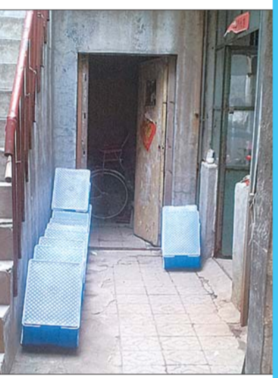
王炉庄一家餐具消毒作坊内摆着十几个盛放餐具的箱子。

7日,本报以《被取缔餐具消毒作坊有的还在偷偷干》为题,对一些被取缔餐具消毒作坊仍偷偷开工的情况进行报道,引起了广大市民关注。不少市民纷纷通过热线举报身边的一些餐具消毒小作坊。记者暗访发现,一间屋子、几名工人、一部封装机就“组成”餐具消毒厂,而且餐具洗刷好后竟是风扇吹干的,但是别小看他们的实力,很多正规的企业都被他们挤垮了。