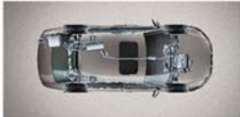
AAC全独立主动响应式底盘悬挂系统