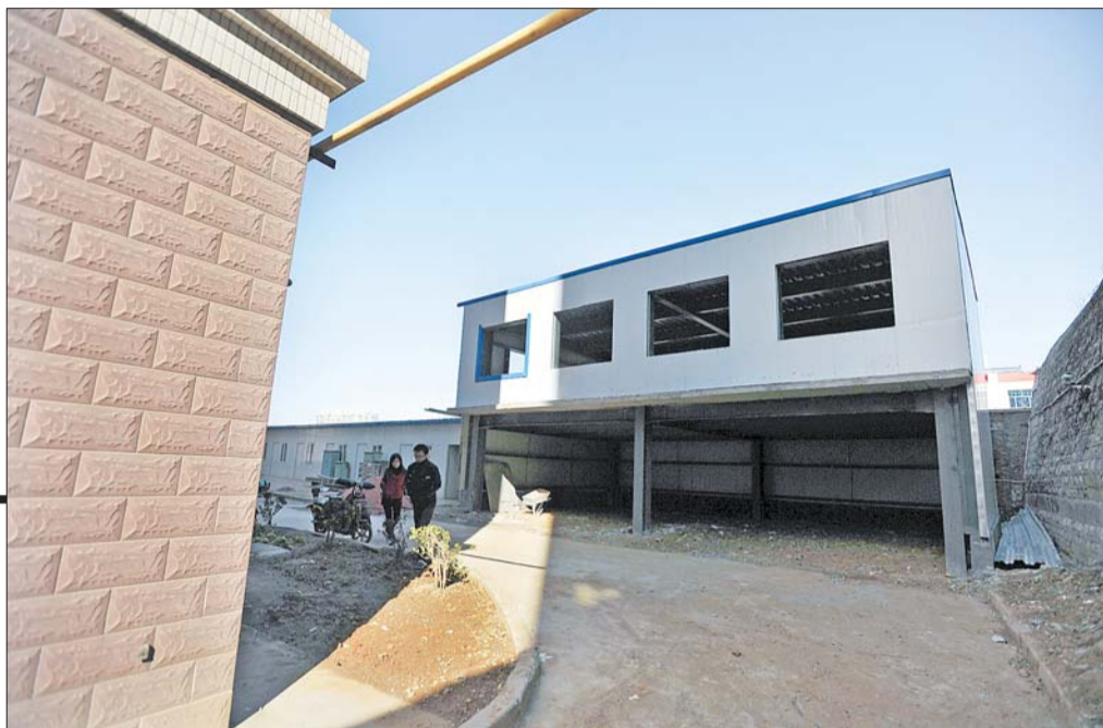
▶13日,在紫荆苑小区东北角,一座还未完工的二层小楼“挤”在小区楼房的拐角处。

小区东北角好好的一块空地,近日凭空多出了两层小楼,离居民楼仅四五米的距离,让小区的业主很不满。历下区浆水泉路紫荆苑小区业主反映,物业私自将空地改成车库,并且以15万元的价格对外出售。13日,记者对此进行了调查。