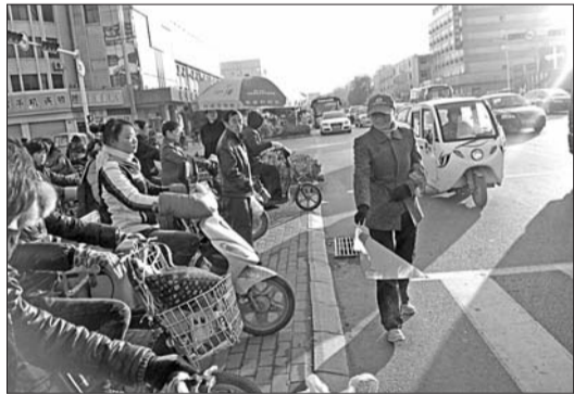
文明巡访团志愿者正在指挥交通。

“由社区居民组成的文明市民巡访团,专管街面、社区鸡毛蒜皮的小事,专向市民不文明行为‘挑刺’。他们管的虽然是小事,却起到大作用。”市中区委宣传部副部长、文明办主任龙涛说,市中区还在充实以“文明市民巡访团”为主的三支志愿服务队伍。除了开展环境卫生专项巡访月、交通安全专项巡访月等志愿活动,他们还将联系驻辖区文明单位开展“共驻共建新中区”活动。