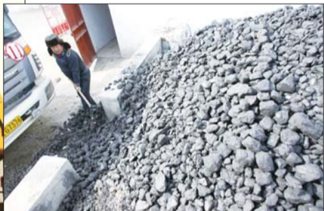
▼工地上,烧锅炉用的煤已经开始储备。