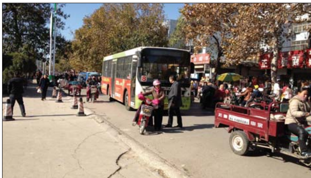
摊位挤在路上,公交车难通过。

13日下午,泰山城管执法局工作人员称,市政府增设了一些临时摊点群,方便摊贩摆摊。“但是向阳路上的摊位是否属于临时摊点群,我们不太清楚。”工作人员说。