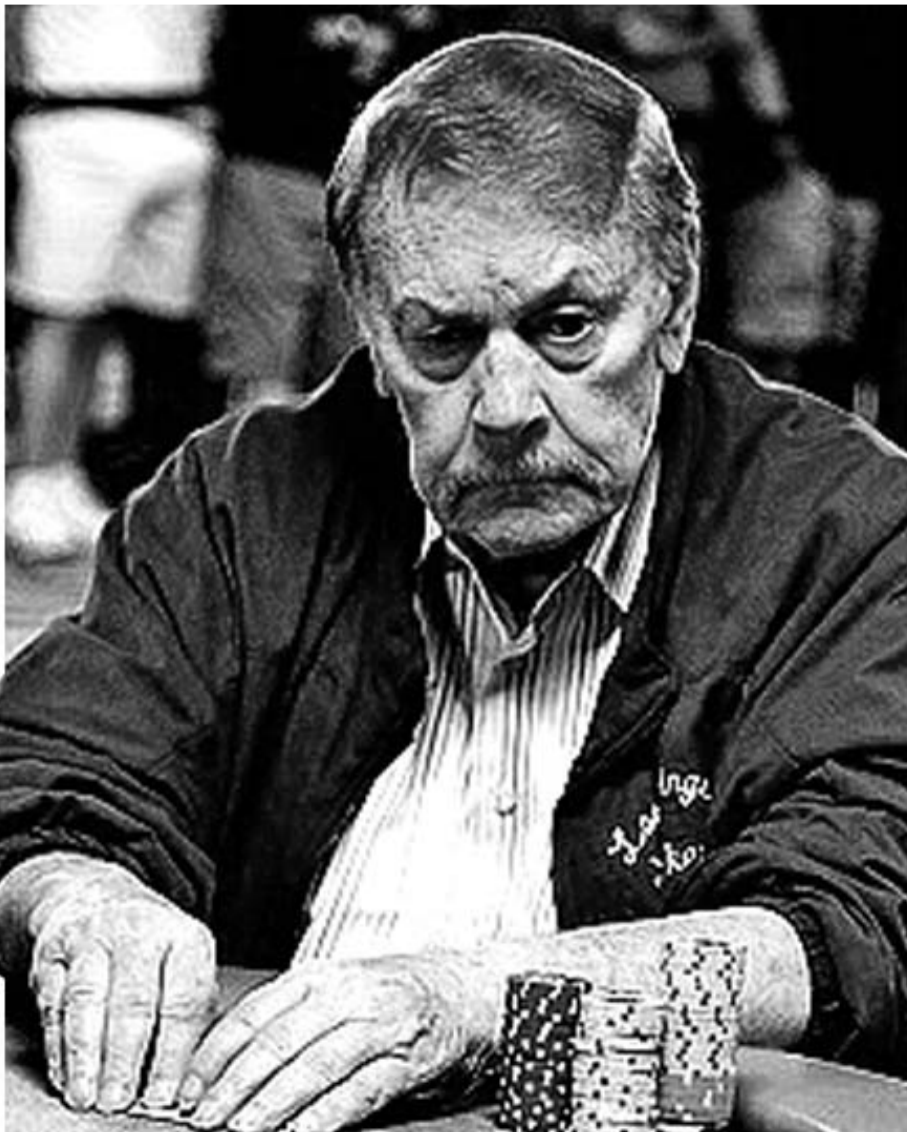
杰克逊和德安东尼都是筹码,老巴斯才是背后的大玩家。

如今,剧情已经尘埃落定:德安东尼拄着双拐走马上任,湖人翻开新篇章;禅师要价太高,索要甚重,“打入冷宫”咎由自取,事实果真如此?恐非尽然。接下来,我们通过还原一些细节,将一个更清晰的湖人换帅呈现在读者眼前。届时你会发现,聪明如禅师,也不过是湖人老板杰里·巴斯手中的一枚棋子。风烛残年的老巴斯,但凡有一口气,依然把所有人蒙在了鼓里,“老狐狸”三十三年屹立不倒,真不是盖的。