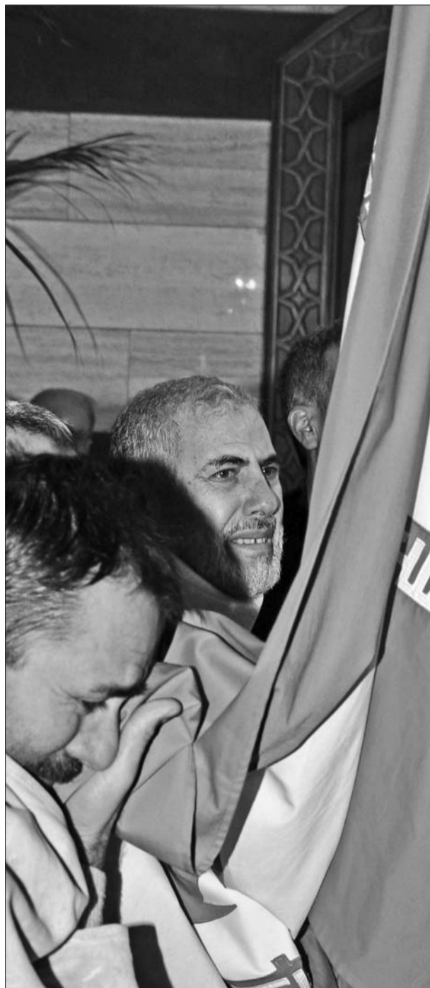
9日,在叙利亚首都大马士革,获释的伊朗人质亲吻国旗。

近期,反对派武装在北部塔夫坦纳兹发起新一轮攻势,试图攻占上周持续三天没有攻下的一座空军基地。历经半年争夺,反对派武装现在控制叙利亚北部和东部大片地区以及首都大马士革郊区和周边城镇。同时,政府军仍牢牢控制人口稠密的西南、地中海沿岸、国内南北交通动脉和军事基地。