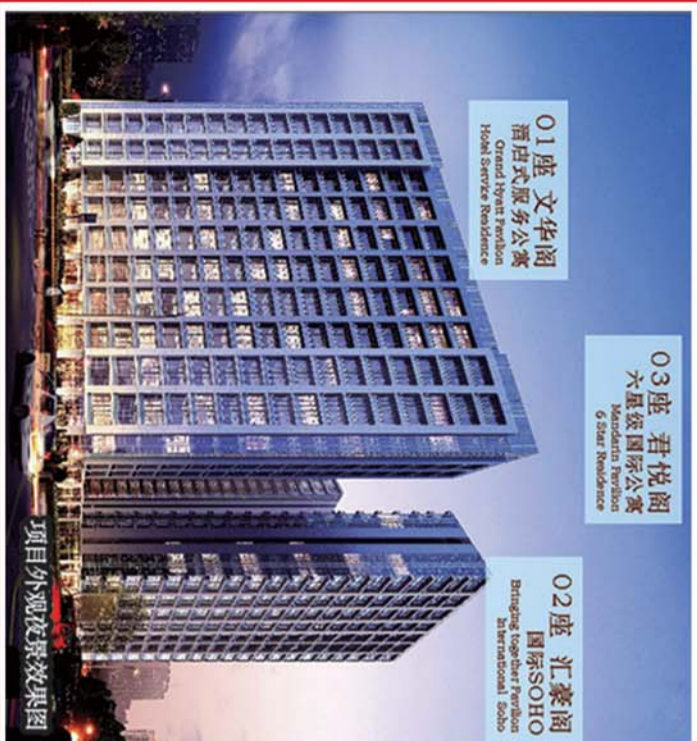
项目外观夜景效果图

01座 文华阁 酒店式服务公寓 Grand Hyatt Pension Hotel Service Residence