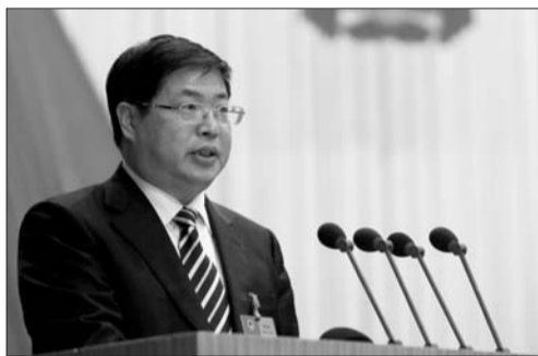
▲淄博市市长徐景颜在会上讲话。

本报1月10日讯(记者 樊伟宏 见习记者 李超 谭文佳) 10日上午,经淄博市第十四届人民代表大会第二次会议第三次全体会议投票选举,市委副书记、代市长徐景颜当选新一届淄博市人民政府市长。在随后的发言中,徐景颜表示,淄博市人民政府将真心实意多努民生之力、多解民生之忧,多办顺民心、合民意、看得见、摸得着的好事、实事,让群众生活有新的