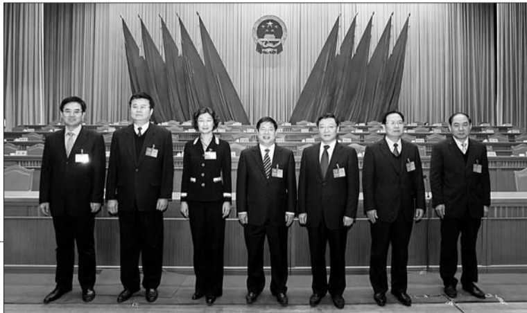
▶市政府主要领导在会后合影。

的城市,其发展前景无限广阔,站在新的起点上,面对新的机遇和挑战,新形势、新任务,一定要牢牢坚持“发展是硬道理”的战略思想,更加注重抢抓发展机遇,更加注重尊重经济规律,聚精会神谋科学发展,同时自觉接受人大、政协和社会各方面监督,竭尽全力为淄博的快速发展和社会主义贡献自己的力量。