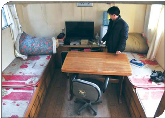
工作人员蜗居在船上几平方米的房间里。