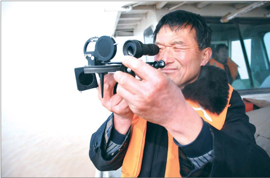
利用六分仪进行定位。