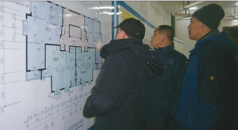
搬迁人正在选择户型。

本来确定的搬迁安置签约奖励期限为1月21日至4月20日,但有搬迁人要在21日前回东北老家过年,无法办理房屋腾空交接验收手续,想提前交房。搬迁指挥部决定,对于有特殊情况的搬迁人,18日起就可以办理搬迁签约。