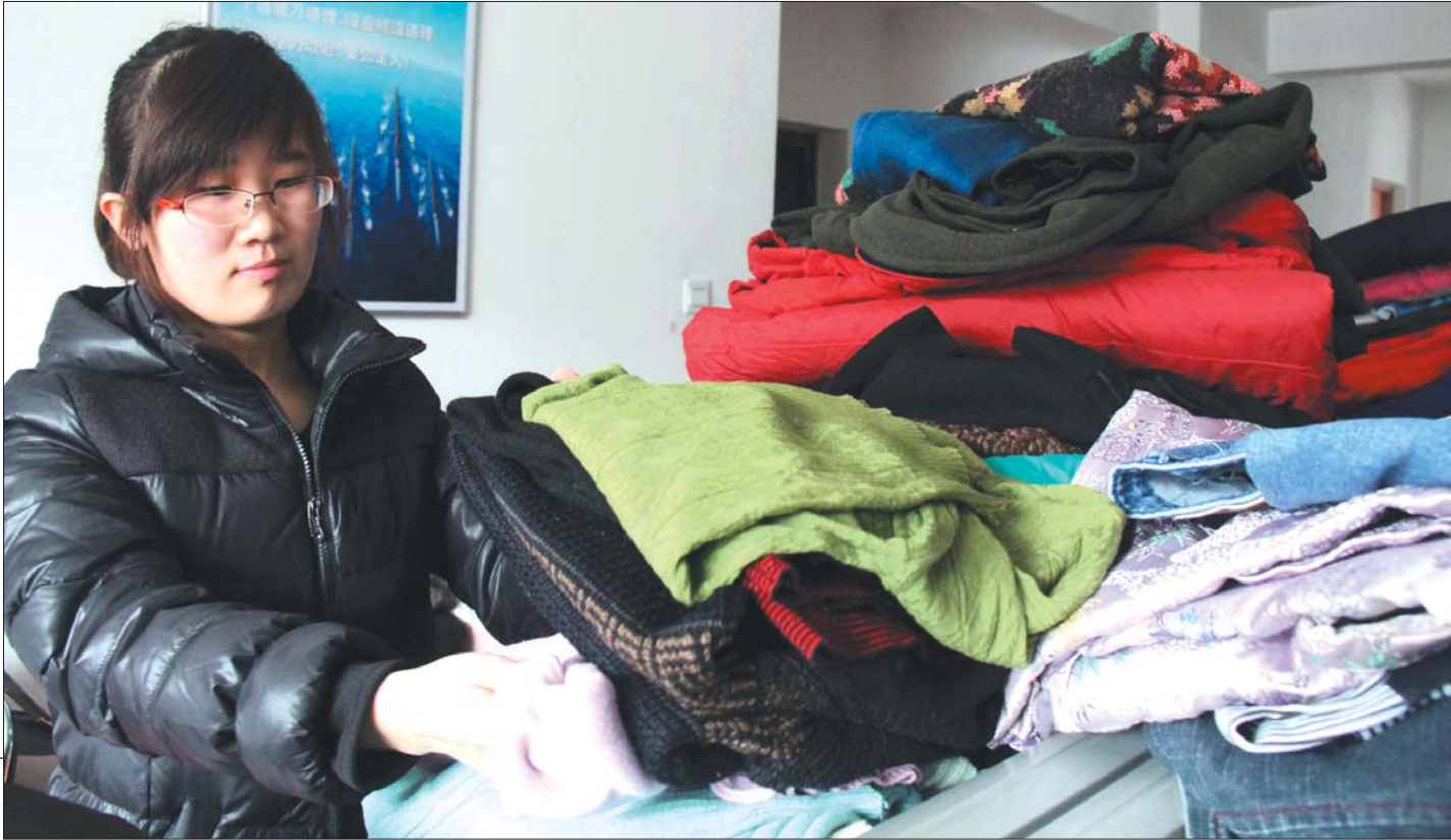
一名工作人员正在清点衣物。