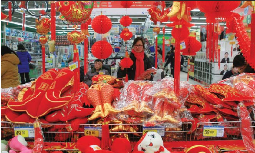
▲一位市民正在超市内挑选商品。