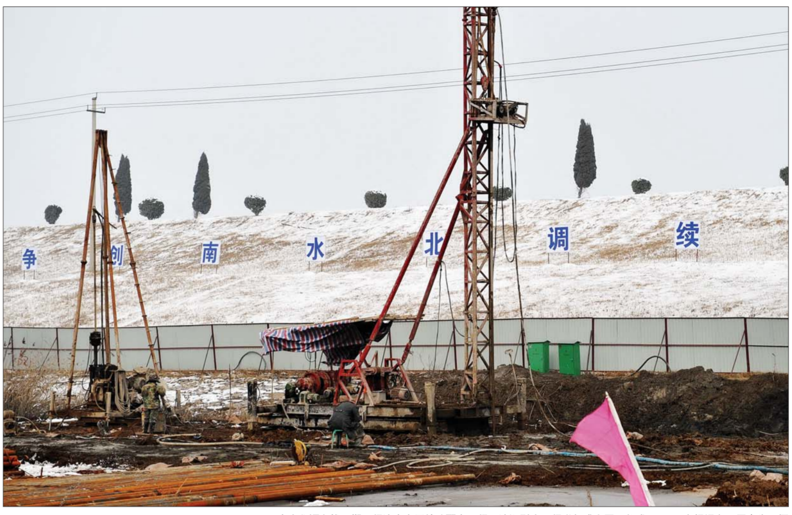
23日,南北水调东线一期工程济南市区续建配套工程玉清湖引水工程举行盛大开工仪式。

苏宁在春节前假期Expo超级旗舰店时发现,店内人气火爆,消费者纷纷抢购,整个购物环境都充满了“年货”的氛围。在一张电灯上,还布置了年货家电的集中展示,红红的对联与福字让人感受到浓浓的节日氛围。