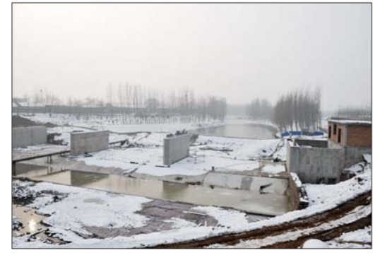
玉符河橡胶坝工地。