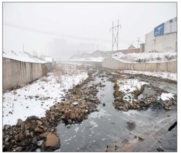
拓宽后的大辛河。