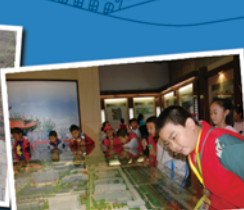
小记者们走进曲阜大校园