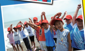
小记者们在日照海滩

好消息!好消息!齐鲁晚报·今日运河编辑部招募2013年度校园小记者活动火爆进行中。想让自己的文字带着墨香变成报纸上的铅字吗?想跟随记者现场采访新闻吗?