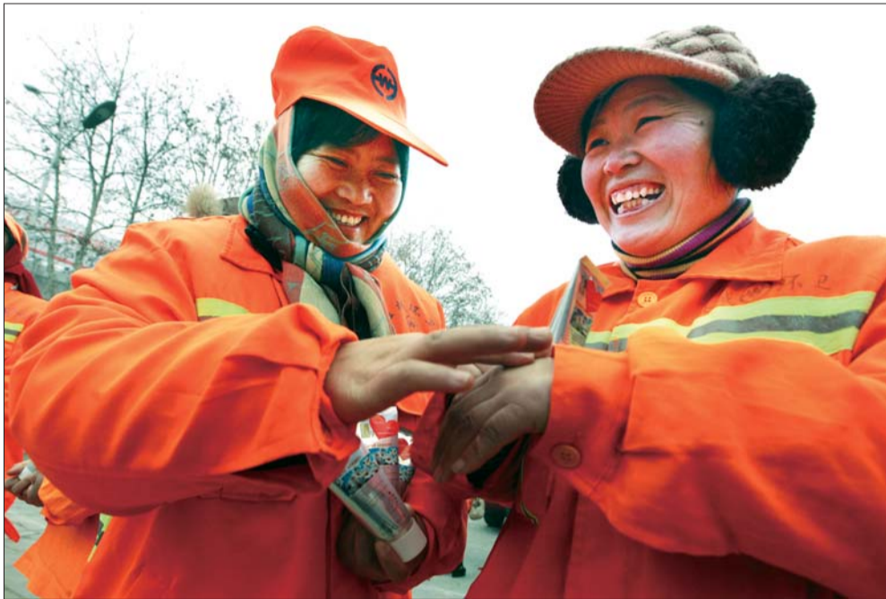
领到了护手霜,两位环卫工人立刻用了起来。

栾经理表示,在为环卫工捐赠护手霜的同时,他们将统计环卫工人一些基本信息,为他们免费办理广联医药连锁药店的会员卡,让环卫工人可以在药店内享受一定程度优惠。