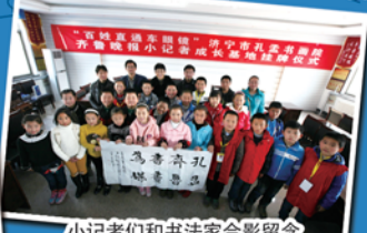
小记者们和书法家合影留念