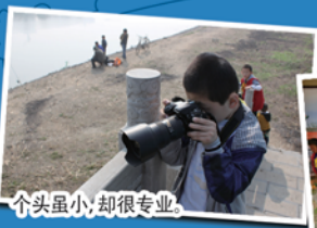
个头虽小,却很专业