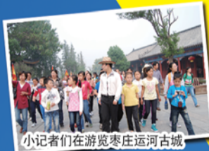
小记者们在游览枣庄运河古城