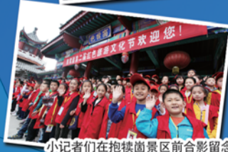
小记者们在抱犊崮景区前合影留念